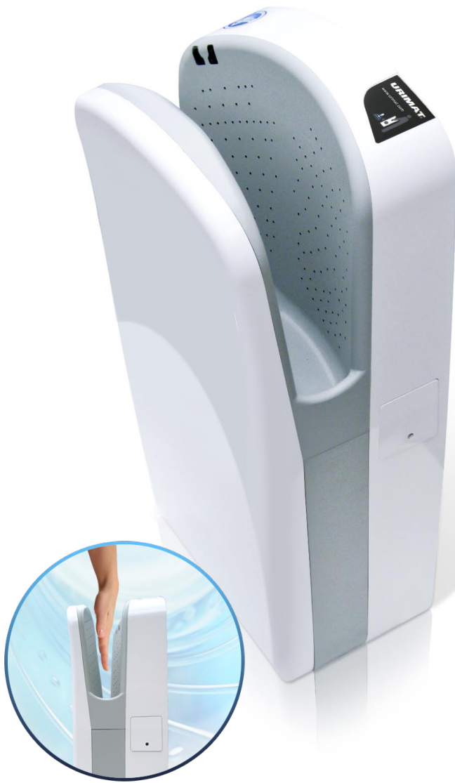
URIMAT Händetrockner Art.-Nr. 37.500